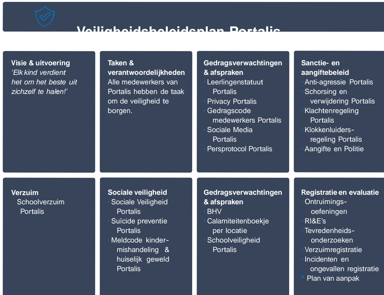
Figuur 1. Overzicht veiligheidsbeleidsplan

Figuur 1 biedt een overzicht van de inhoud van dit plan.